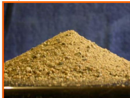
Figur C: Tør tilstand. Opprinnelig kjegle er totalt kollapset og en ny "kjegle" med tydelig spiss er oppstått. Ved stamping reduseres høyden nesten ikke. Materialet i figuren var tørret i 24 timer før prøving