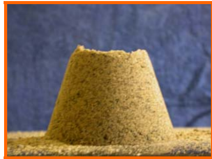
Figur A: Våt tilstand. Tilslaget har samme form som kjeglekonusen. Ved stamping reduseres høyden med ca 2-3 cm

Problemet er at det er uoverensstemmelse mellom teksten og de informative figurer der beskriver når vannmettet overflatetør tilstand (VOT) oppnås. Figur C som skal brukes til å vurdere når materialet er i VOT tilstand er ikke korrekt. Figur C som finnes i standarden og kontrollrådets metodesamling viser derimot en situasjon hvor materialet er tørt. Samme kjegleform kan fås ved prøving av tørt tilslag som vist i etterfølgende figur C.