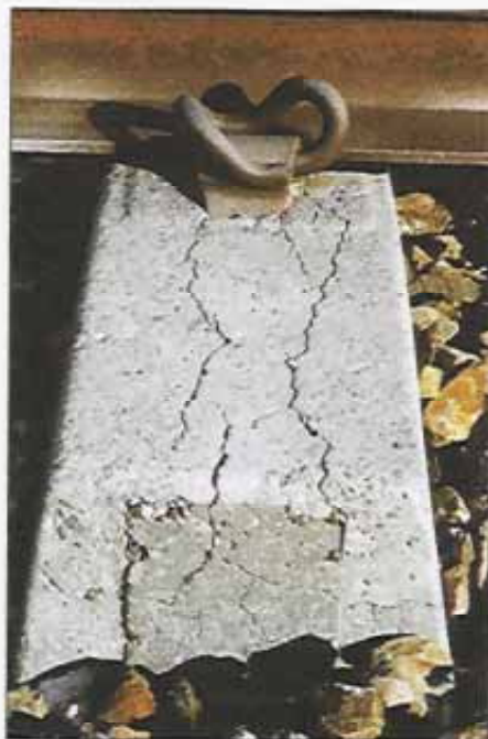
Sviller produsert i Verdal i 1973. Det ses flere langsgående riss/sprekker ved svillendeenden.