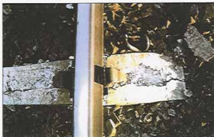
Sviller produsert i Moss i 1978. Det ses riss/sprekker og avskallet betong. Svillen er sterkt skadet og det er risiko for at skinnefestet er løst. Frysetingprosesser har sannsynligvis forverret nedbrytingen av betongen.

rissvidde opp til 1 mm (1996). Maksimale rissvidder er anvendt til klassifise-